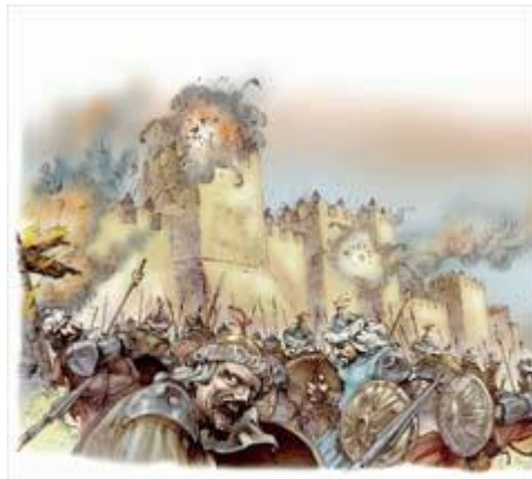
Илустровао Горан Горски

Р еч је о времену кад су једно за другим падала последња упоришта хришћанског света на источном Средоземљу и у југоисточној Европи: Цариград 1453, Смедерево и српска средњовековна држава 1459, византијска Мореја (Пелопонез) 1460, Трапезунтско царство на југоисточним обалама Црног мора 1461, средњовековна босанска држава 1463, острво Еубеја 1470, Херцеговина 1482, славни Египат 1517, Београд 1521, острво Родос 1522, Будим 1541. године. На другој страни, био је то крај српске средњовековне државе која је постојала неколико столећа.